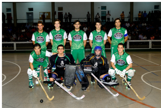
(PT)- HC Liceo Coruña Campeão de Espanha 2012-2013 (ESP)- HC Liceo Coruña Campeón España 2012-2013 (FR)- HC Liceo Coruña Champion Espagne 2012-2013 (ENG)- HC Liceo Coruña Spain Champion 2012-2013