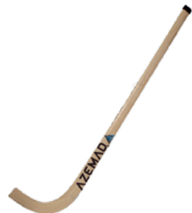
BR 670 Stick Stick Azemad até aos 3 anos