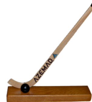
BR 661 Stick Azemad c/ base (32cm)