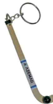
BR 650 Porta Chaves Azemad (9cm)