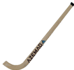
BR 660 Stick Azemad (32cm)