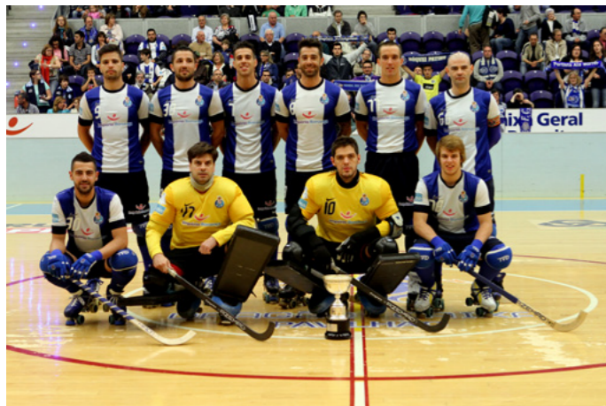
(PT)- F. C. Porto vencedor Taça de Portugal e Campeão Nacional 2012-2013 (ESP)- F. C. Porto ganador de la Copa de Portugal y Campeón Nacional 2012-2013 (FR)- F. C. Porto gagnant de la tasse du Portugal et Champion National 2012-2013 (ENG)- F. C. Porto winner the Cup of Portugal and National Champion 2012-2013

Os Campeões preferem Azemad/ Los campeones prefieren Azemad/Les champions préfèrent Azemad /The Champions prefer Azemad