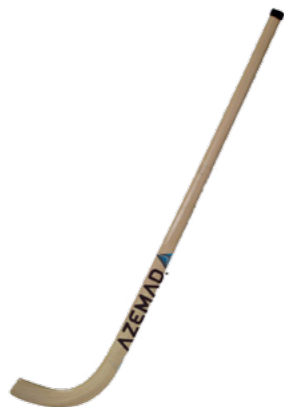
BR 671 stick Azemad dos 3 aos 5 anos