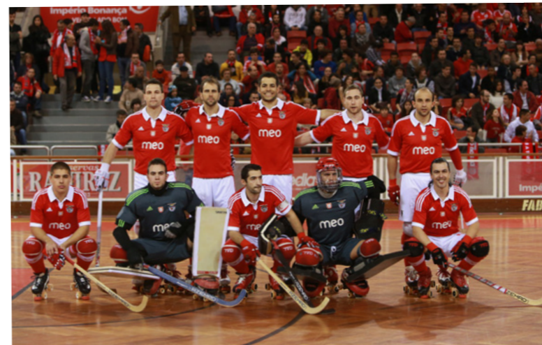
(PT)- S. L. Benfica vencedor Liga Europeia 2012-2013 (ESP)- S. L. Benfica ganador del Liga Europa 2012-2013 (FR)- S. L. Benfica gagnant de la League de Europe 2012-2013 (ENG)- S. L. Benfica winner of the Europe League 2012-2013