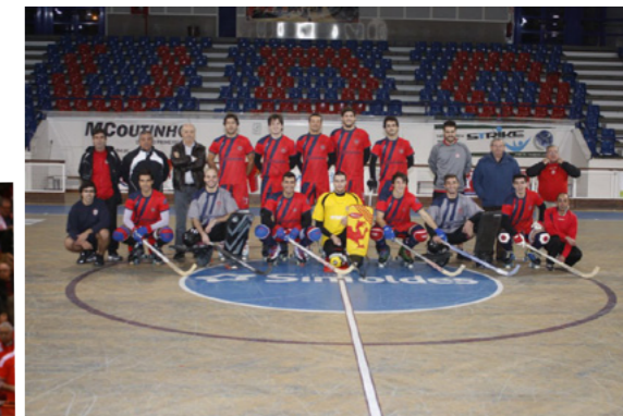
União Desportiva Oliveirense