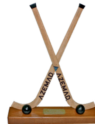
BR 662 Stick Azemad Duplo c/ base (32cm)